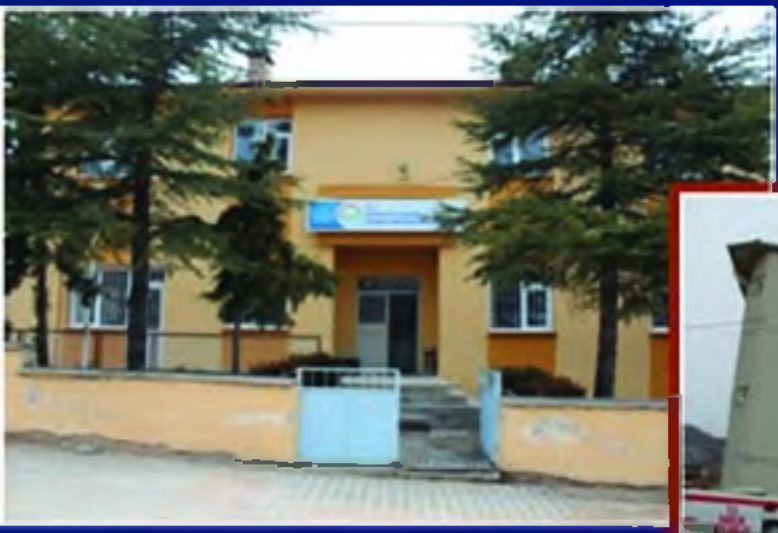
Gıda Tarım ve Hayvancılık Müdürlüğü