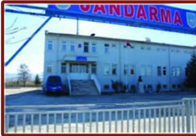
İlçe Jandarma Komutanligi