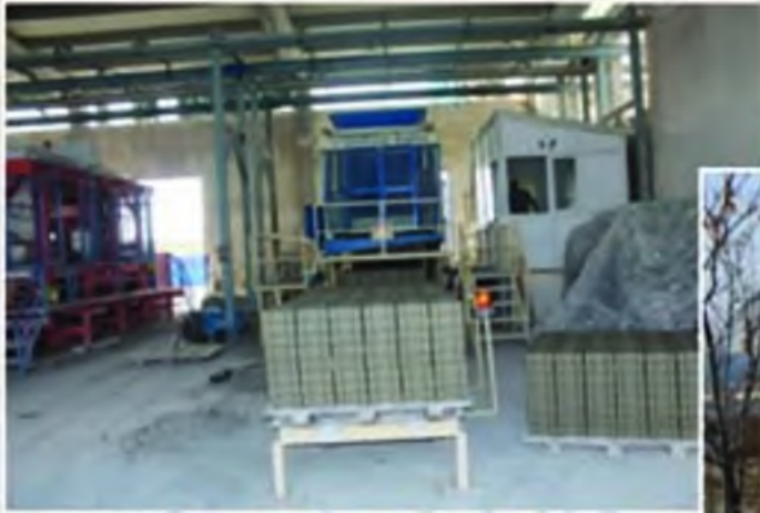
Beton parke ve üretim fabrikası