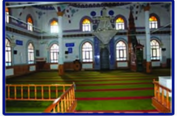
Merkez Ulu Camii

İlçemizde müftülüğümüze bağlı 8 cami, 3 Kur'an kursu bulunmaktadır. Camilerimizde ve Kur'an kurslarımızda yeterli sayıda görevlimiz hizmet vermektedir.