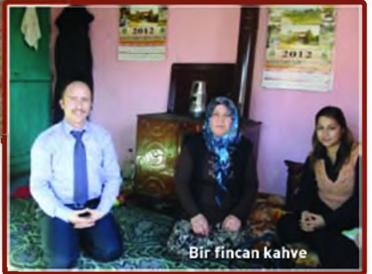
Bir fincan kahve