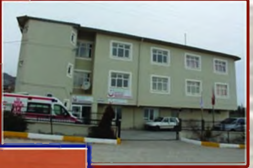
Sağlık Grup Başkanlığı