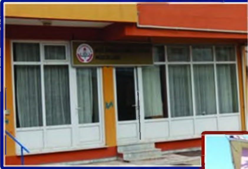
Milli Eğitim Müdürlüğü