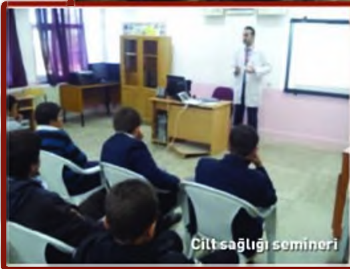
Cilt sağlığı semineri