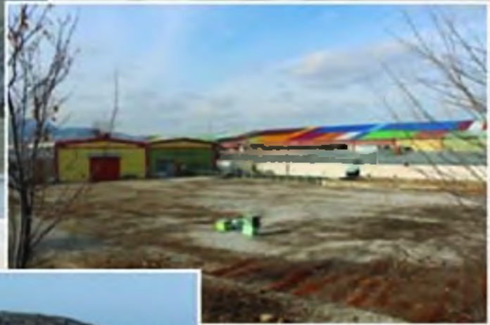
Yetas (Albinol) Mobilya Fabrikası