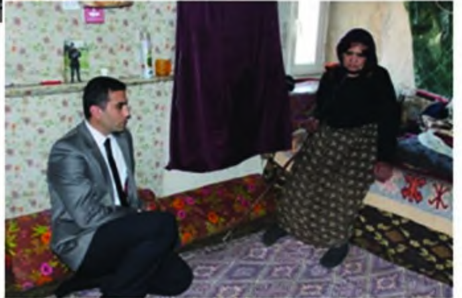
Sayın Kaymakamımızın hane ziyaretleri