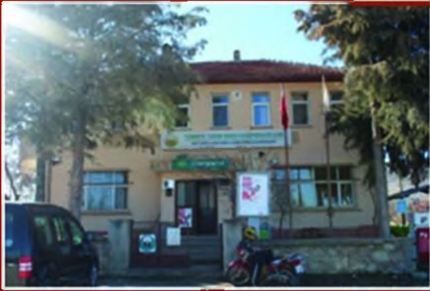
Tarım Kredi Kooperatifi