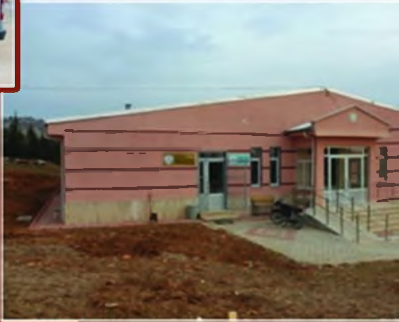
Halk Eğitim Merkezi