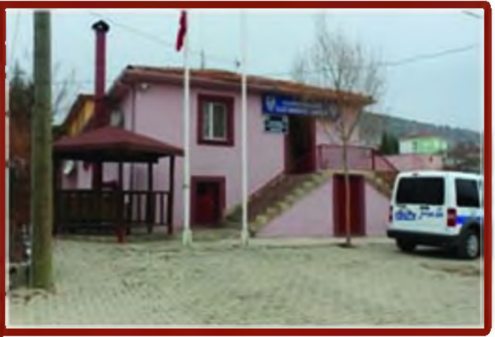
İlçe Emniyet Amirliđi