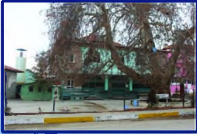
Koruma altındaki Çınar ağacı