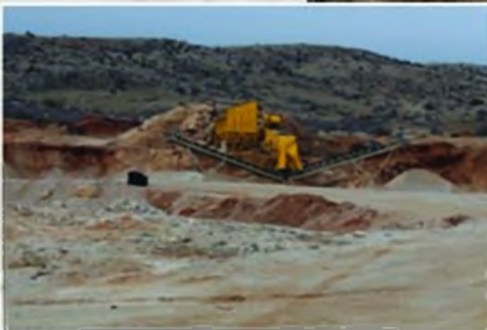
Belediye Kum Ocağı